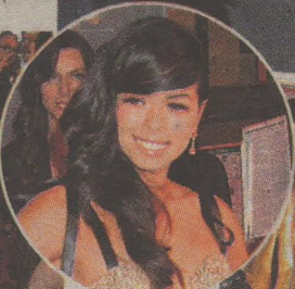
▲ DSDS-Jurorin Fernanda Brandao (27)