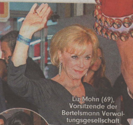
Liz Mohn (69), Vorsitzende der Bertelsmann Verwaltungsgesellschaft